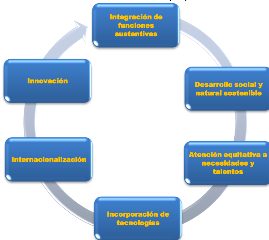
Gráfico 1. Ejes del Modelo Académico.

El presente Modelo Académico indica la consideración de seis ejes en el desarrollo de las funciones sustantivas y el diseño de los programas educativos y académicos de la institución. Estos ejes son: Integración de funciones sustantivas; Desarrollo social y natural sostenible; Atención equitativa a necesidades y talentos; Incorporación de tecnologías; Internacionalización; e Innovación. Estos ejes deben interactuar entre sí, para favorecer una formación integral de alto nivel.