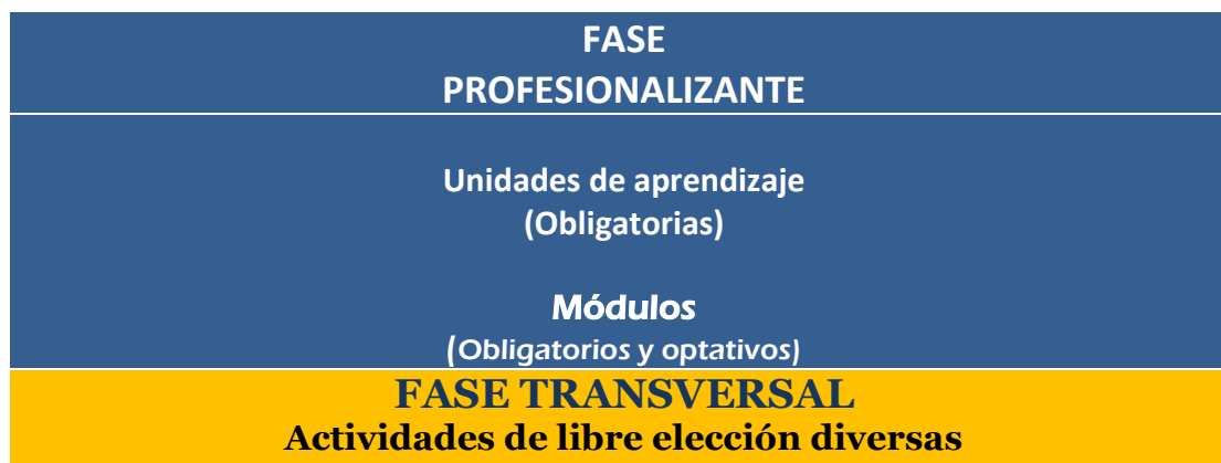
Gráfico 6. Itinerario formativo de Especialidad

FASE TRANSVERSAL, se concretará en el diseño de actividades de libre elección, dirigidas a fortalecer la profesionalización o competencias para la investigación. Algunas actividades pueden ser conferencias, seminarios, participación en congresos, publicaciones en revistas indexadas y arbitradas.