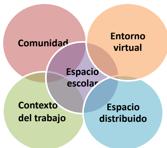
Gráfico 2. Espacios formativos.

En la actualidad, el aprendizaje se extiende a todos aquellos espacios que favorecen la puesta en marcha de habilidades para la investigación y la difusión de conocimiento, por lo cual la Universidad debe expandir las posibilidades de interacción e intercambio de estudiantes a través de promover su participación en eventos académicos, congresos, veranos de investigación, y otras actividades extramuros que les permitan desarrollarse de manera integral. Esto incluye espacios que enriquezcan su cultura y fortaleza física mediante actividades artísticas, físicas y deportivas.