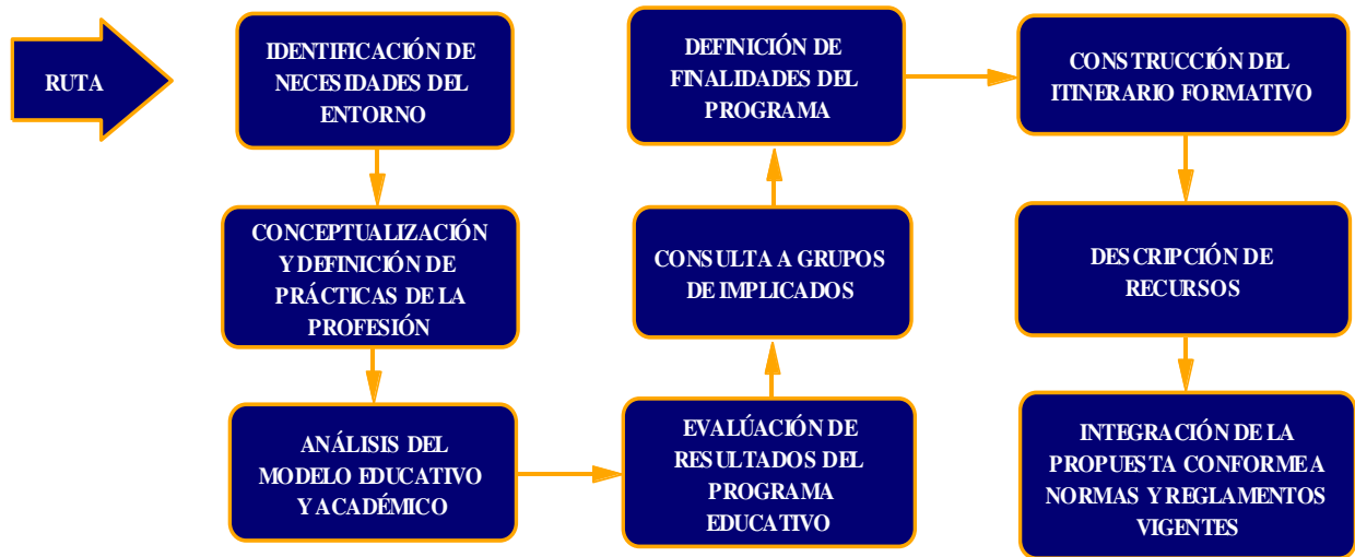
Gráfico 3. Ruta general para el diseño de programas educativos.